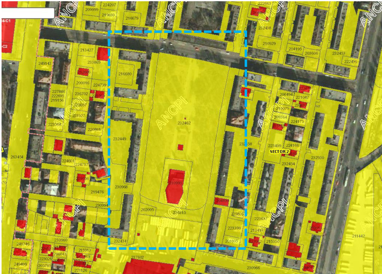
Extras din încadrare în ANCPI, imobile eTerra

În ceea ce privește punctul 3) privind revizuirea autorizațiilor de construcție din zona Hala Ford și limitarea construirii blocurilor noi la un regim de înălțime P+4E, va aducem la cunoștință că Hala Ford nu se află în limita administrativă a Sectorului 2, ea fiind amplasată în cadrul Sectorului 1.