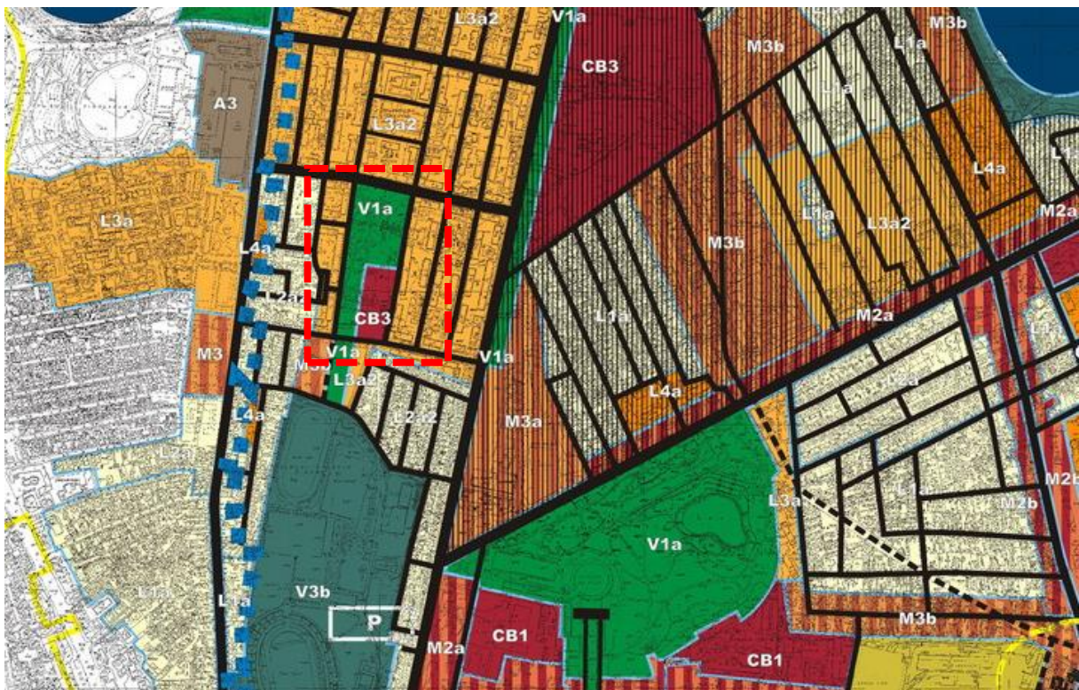
Extras din PUZ Sector 2, aprobat prin HCL nr 99/2003

Conform PUG Municipiul București, aprobat prin HCGMB nr 269/2000 Parcul Vinema Floreasca este încadrat parțial în UTR V1a - V1a - Parcuri, grădini, scuaruri și fâșii plantate publice; și UTR M3 - subzona mixtă cu clădiri având regim de construire continuu sau discontinuu și înălțimi maxime de P+4 niveluri.